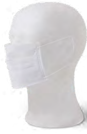
72 Mascarilla desechable