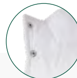
Cierre botones automáticos