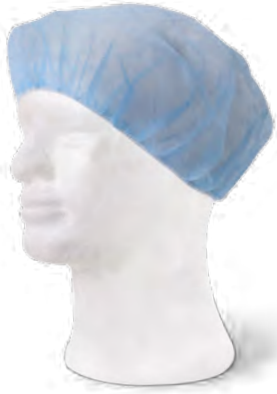
78 Gorro desechable