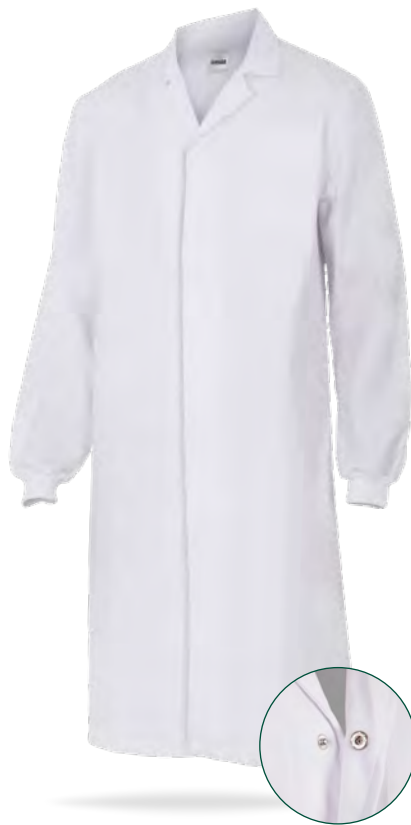
Cierre de automáticos