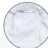
Bolsillo interior cinturilla