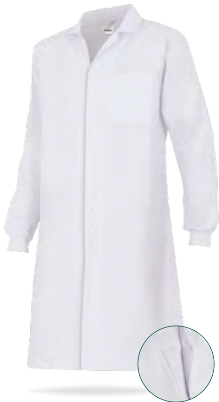
Cierre de velcro