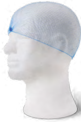
79 Cofia desechable

Tejido no tejido 100% polipropileno 20 gr/m 2