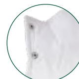
Cierre botones automáticos